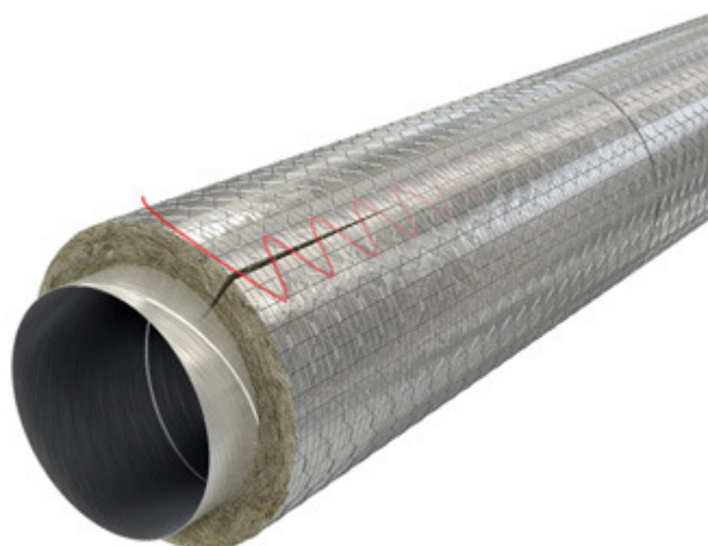
Wired matta fixering med ståltråd